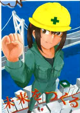
（一社）山口県建設業協会 建設業イメージアップポスター平成 26 年度入賞作品